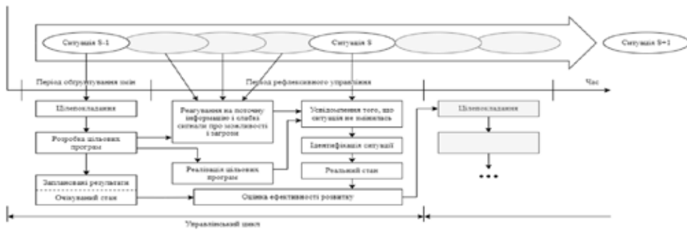
Рис. 2. Схема процесів цілепокладання і рефлексивного управління [16, с. 6]

керівництва, пріоритетності r_g^2 на основі минулого досвіду цілепокладання, готовності внутрішніх суб'єктів господарювання до прийняття g -ої цілі q_g , та прогностичної функції M(r_g, q_g) , яка відображає оцінку наслідків сформованої ситуації в результаті вибору та реалізації g -ої цілі: