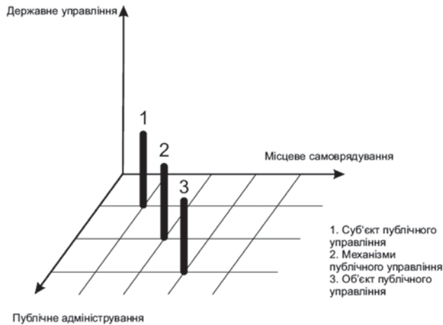
Рис. 1. Складові концепції публічного управління

У сучасній концепції публічного управління особливого значення набуло публічне адміністрування. За визначенням науковців, це «професійна діяльність публічних службовців, яка охоплює всі види діяльності, спрямовані на реалізацію рішень органів державної влади та місцевого самоврядування» [9].