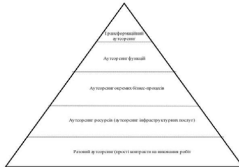
Рис. 1. Практики та аутсорсингові ініціативи в органах публічної влади [1]

Разовий аутсорсинг найбільш поширена форма в органах публічної влади. Аутсорсинг ресурсів, особливо в частині кадрових, передбачає придбання певних ресурсів для забезпечення діяльності органів публічної влади. Аутсорсинг бізнес-процесів в публічних інститутах включає передачу виконання завдань з метою підвищення результативності. А трансформаційний аутсорсинг – це повна реорганізація процесів відповідного органу публічної влади.