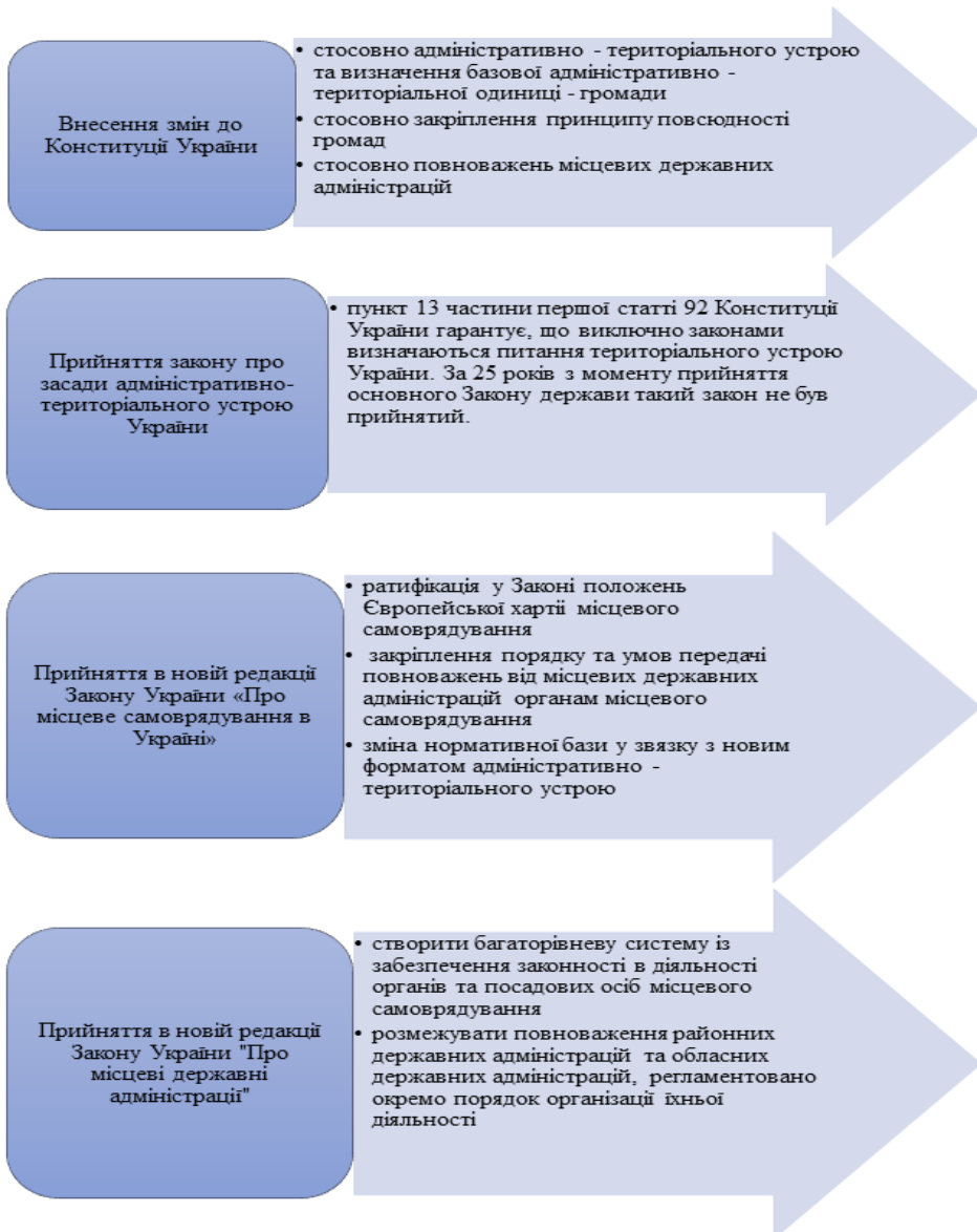
Рис. 2. Законодавчі ініціативи, що визначають основи взаємодії районних державних адміністрацій та органів місцевого самоврядування

Співпраця між цими гілками публічного управління виходить на новий рівень: із новими повноваженнями, завданнями й інструментами. Не зовсім правильно стверджувати, що районні державні адміністрації не є суб'єктами управління для органів місцевого самоврядування. Районні державні адміністрації – представники державної влади на місцях, а отже, дуже важливо обом гілкам влади зрозуміти, що побудова міцної держави неможлива лише за рахунок місцевого самоврядування. Для цього необхідна також сильна й ефективна виконавча влада.